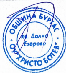
ГРАФИК ЗА ПРОВЕЖДАНЕ НА ЧАС ЗА СПОРТНИ ДЕЙНОСТИ I, II, III, IV, V, VI и VII КЛАС За II учебен срок на учебната 2022/2023 г.